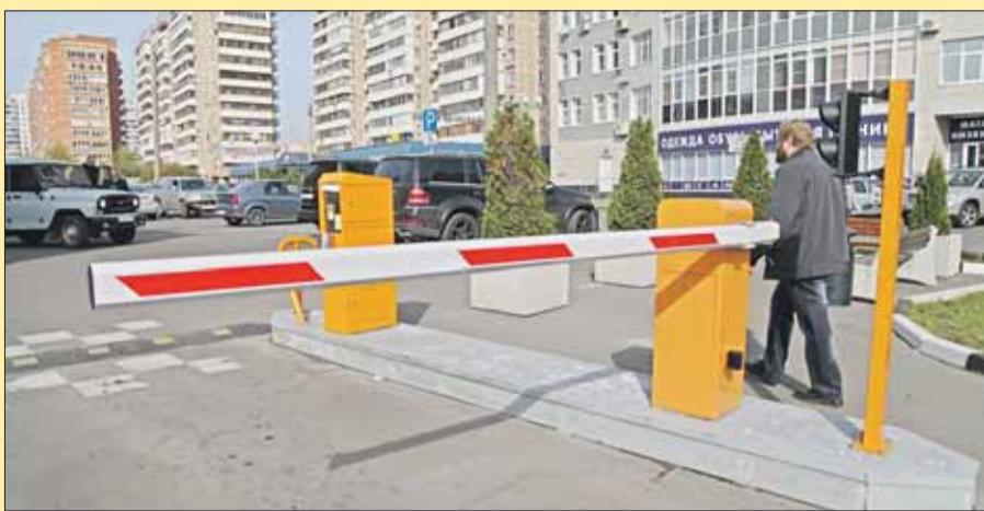
Торговому центру надоело, что его парковку занимают все кому не лень