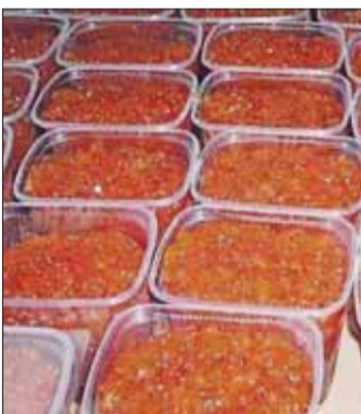
но местные жители высказались против. Сейчас ищут другое место...

— Надо ужесточать ответственность управляющих компаний, — говорит он. — Первый шаг уже сделан. Недавно вступил в силу закон о лицензировании УК. А ещё надо строить легальные общежития для мигрантов. Хотели возвести одно такое на улице Пожарского,