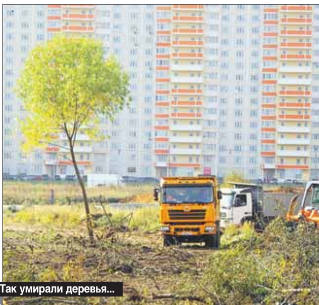
Так умирали деревья...